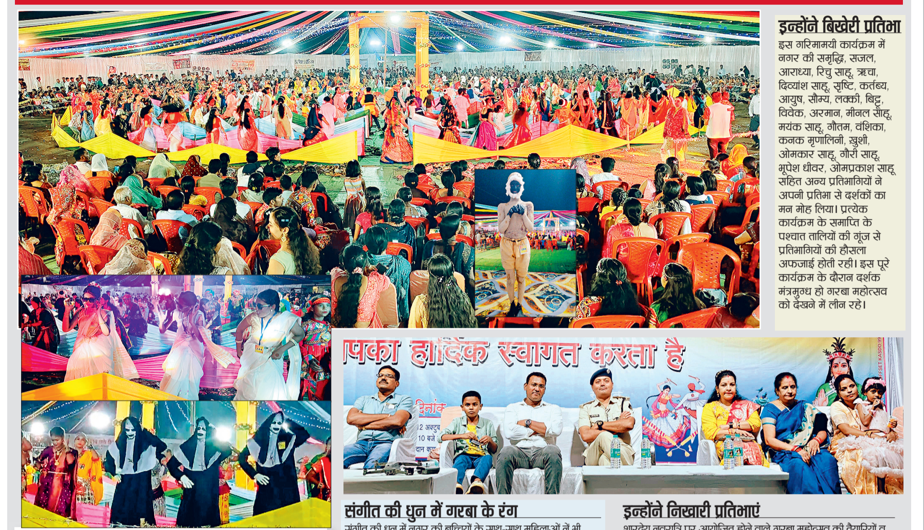
कई थीमों में दिखे शनिवार को गरबे में देश की अन्य राज्यों की पारंपरिक वेश भूषा में प्रतिभागी नजर आए। जिसमें मुख्य रूप से बंगाली थीम, सऊदी अरब थीम, साउथ थीम, गुजराती थीम, राजस्थानी थीम, नए थीम, नन हॉरर थीम, डाकू थीम, मराठी थीम सहित अन्य थीमों में प्रतिभागी अपने कला का प्रदर्शन गरबे में कर रहे थे।